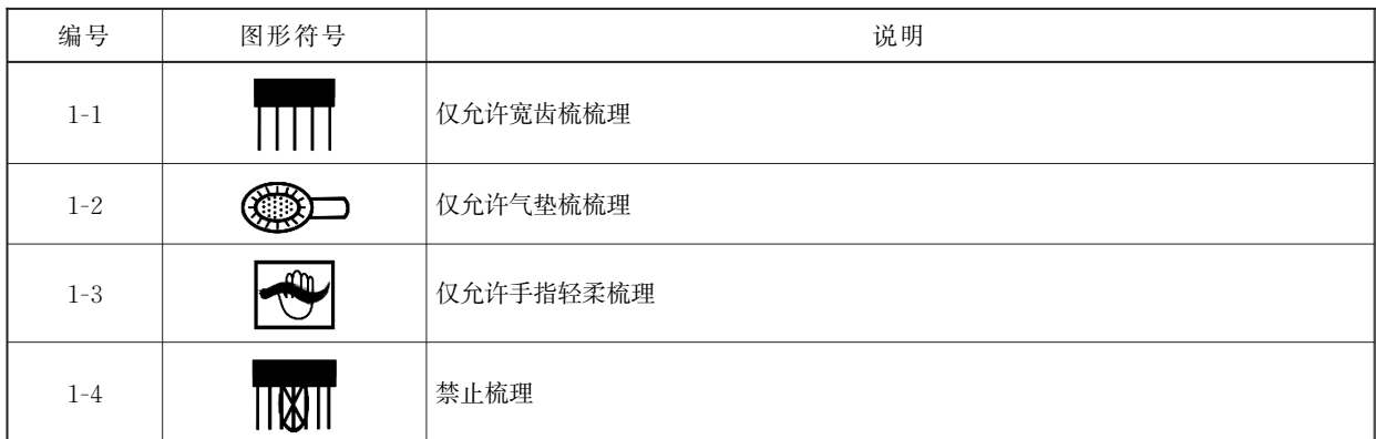
表1 梳理图形符号及说明